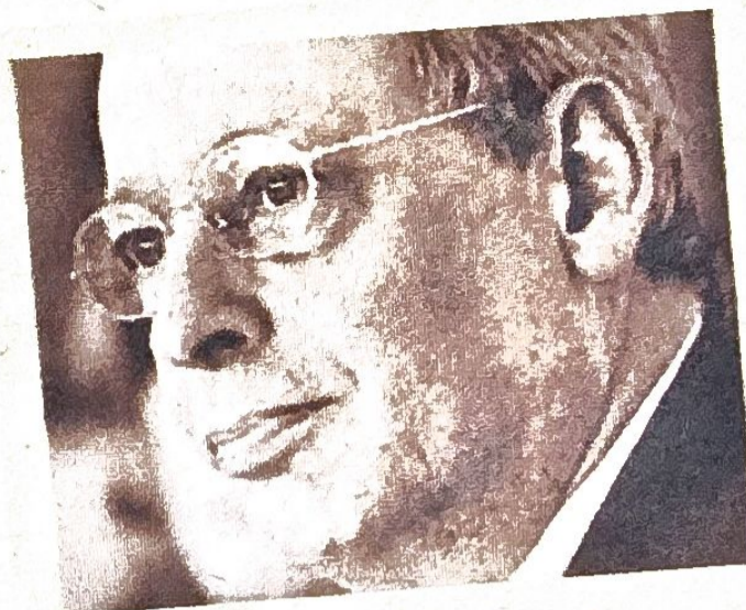
Horacio Verbitsky Periodista-Escritor. Amigo