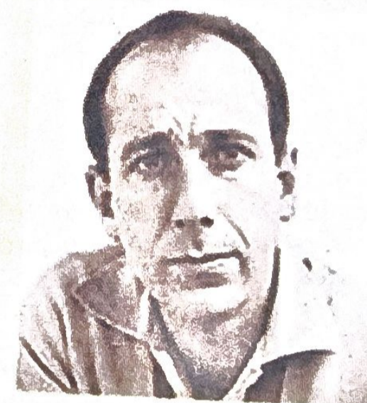
Haroldo Conti Escritor-Profesor. Desaparecido

a destruir toda forma de participación popular. El régimen militar puso en marcha una represión formidable sobre todas las fuerzas democráticas, políticas, sociales y sindicales, con la finalidad de someter a la población mediante el terror de Estado.