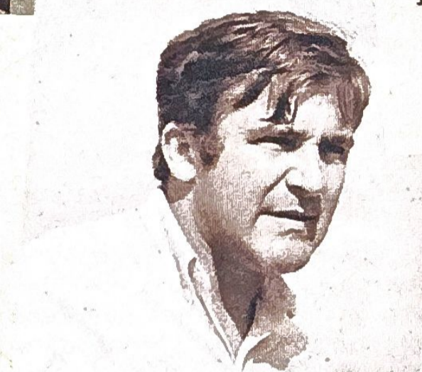
Francisco Urondo Periodista-Militante Político. Desaparecido